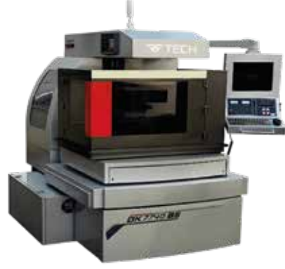
CNC TEL EROZYON TEZGAHI BS-SERİSİ