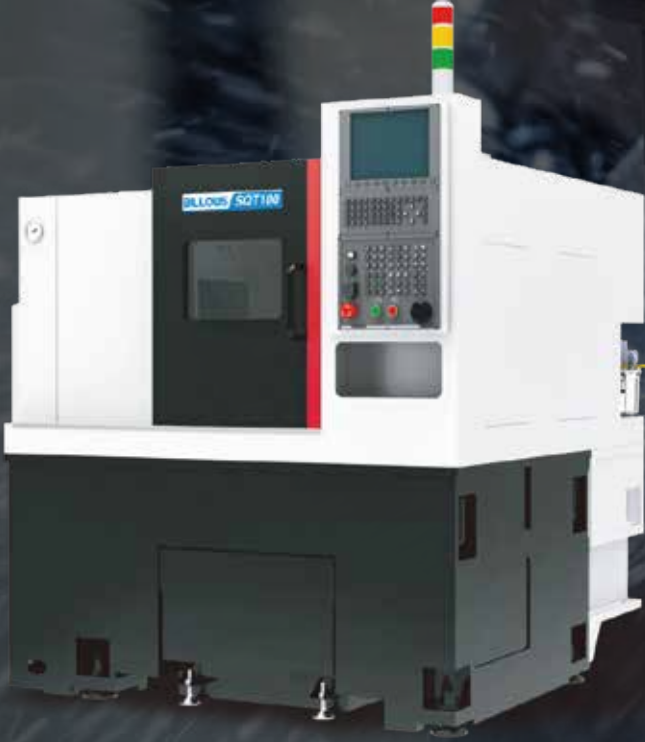
BILLOWS SQT-100 CNC TORNA TEZGAHI