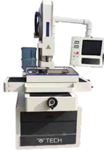
HIZLI DELİK DELME TEZGAHI DD703.35S