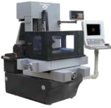
CNC TEL EROZYON TEZGAHI D-SERİSİ