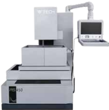
CNC TEL EROZYON TEZGAHI RS-450