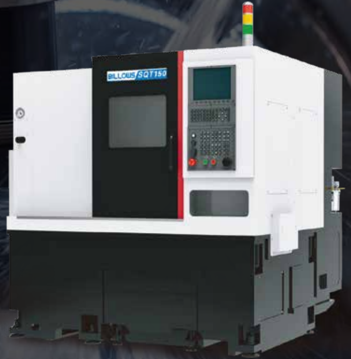
BILLOWS SQT-150 CNC TORNA TEZGAHI