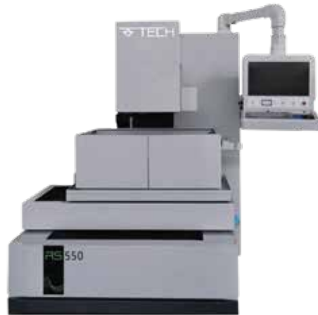
CNC TEL EROZYON TEZGAHI RS-550