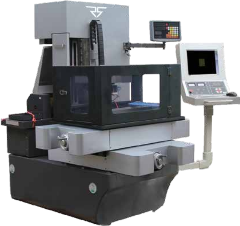
CNC TEL EROZYON D-SERİSİ

İleri teknolojiye sahip makinelerimizle üretim süreçlerinizi daha verimli ve rekabetçi hale getirin.