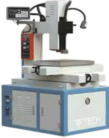
HIZLI DELİK DELME TEZGAHI DD703.30-40